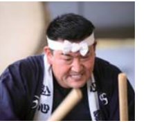
第1回日大ワッショイ!

本県の意見・要望(地方の声)を国へ繋げます。将来を担う子ども達に素晴らしい自然、あたたかい風土、精神を繋げます。